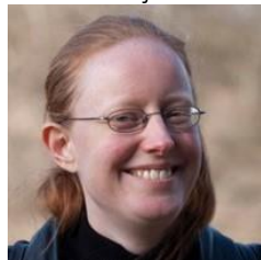
Meertje Hallie Wetenschap